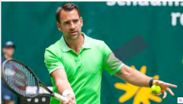
Nicolas Kiefer (Anfänger): Der langjährige Weltklasseprofi hat wieder im Tennis angefangen.

Wir sind heute Mehr als 185 Journalistinnen und Journalisten berufen rund um die Uhr für Sie über das Geschehen in Deutschland und der Welt.